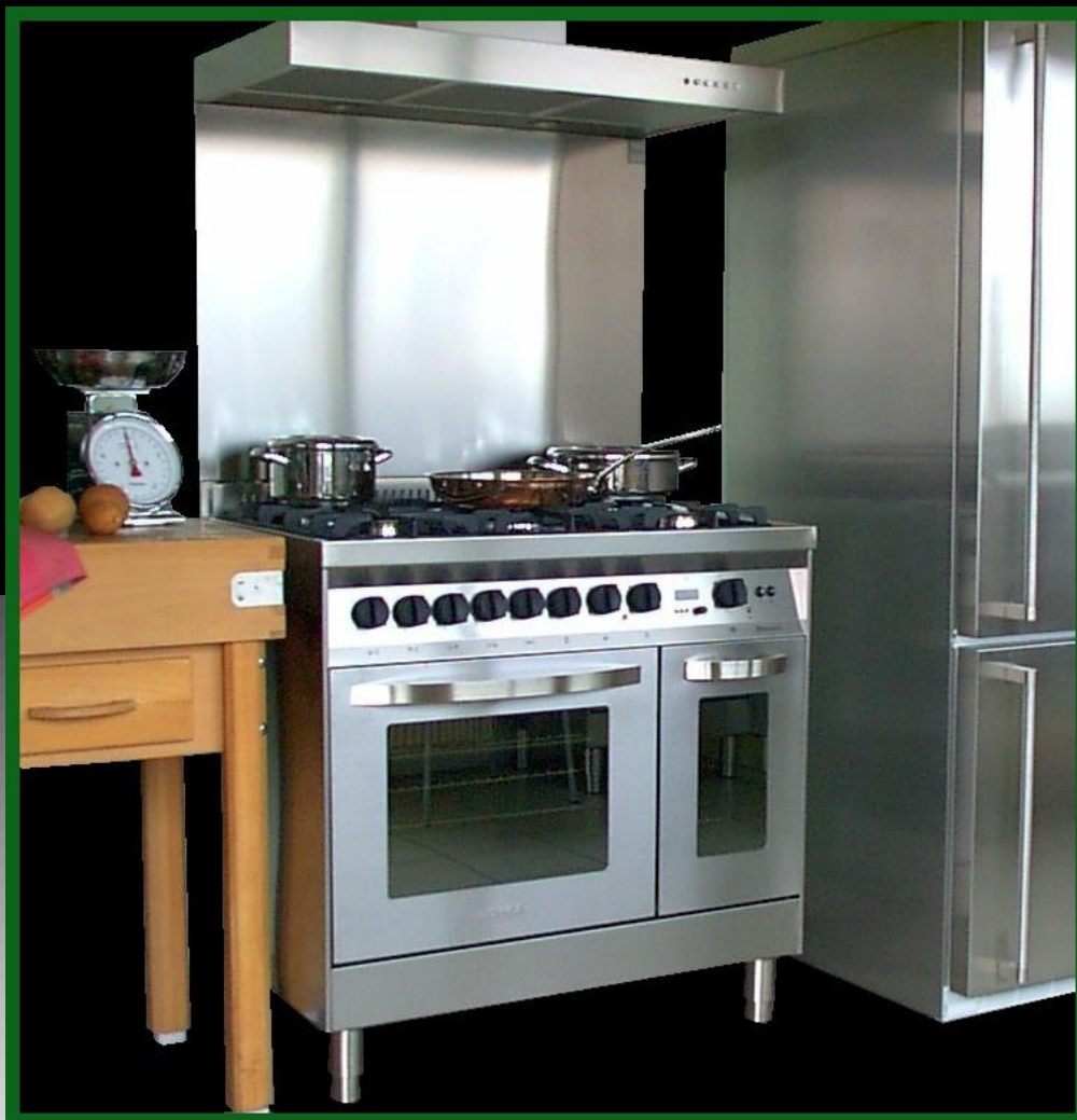
FOURNEAUX DESIGN "PRO" INOX BROSSE