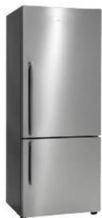
Largeur 63,5 cm

Exemple de combinaison en "side-by-side" présentée avec cadre d'encastrement optionnel en inox