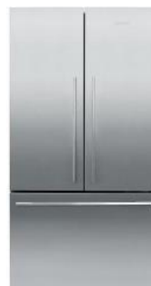
Largeur 79cm ou 90 cm

I&W : modèles équipés du système Ice&Water