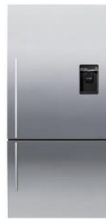
Largeur 79 cm