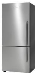
Largeur 68 cm