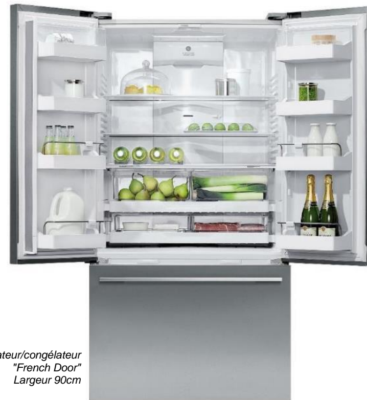
Réfrigérateur/congélateur "French Door" Largeur 90cm

Bacs à produits frais dotés d'un système de réglage du taux d'humidité pour une meilleure conservation