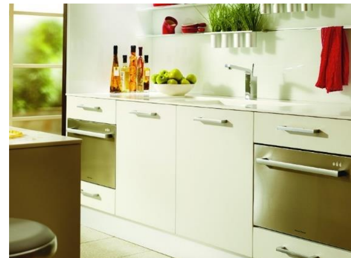
Deux DishDrawer® SIMPLE Designer disposés astucieusement de part et d'autre d'un évier