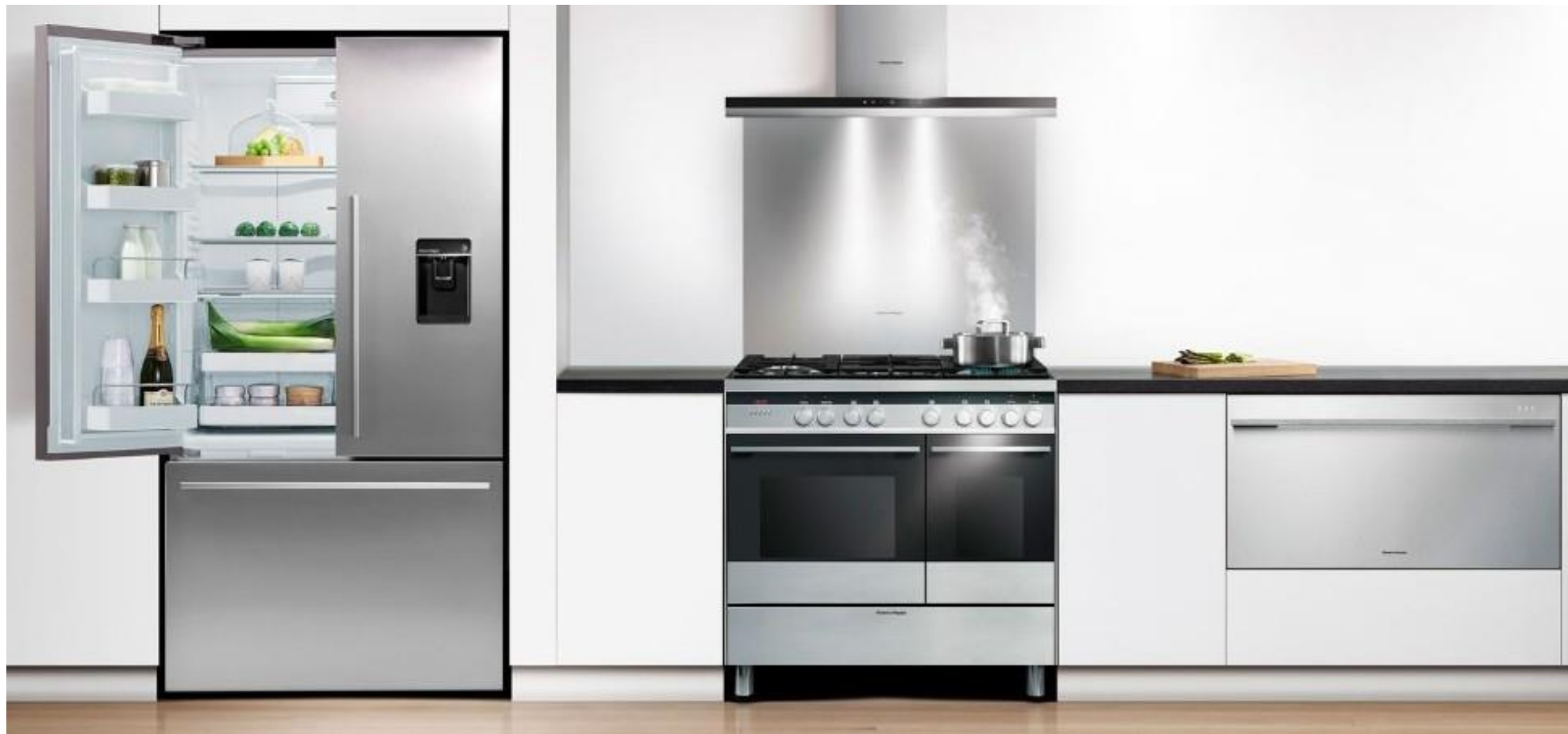
DishDrawer® LARGE présenté à côté d'un centre de cuisson OR90 et d'un combiné réfrigérateur/congélateur RF540A L'esthétique Designer (façade inox et poignée moderne) offre une parfaite harmonie entre les différents appareils Fisher & Paykel.