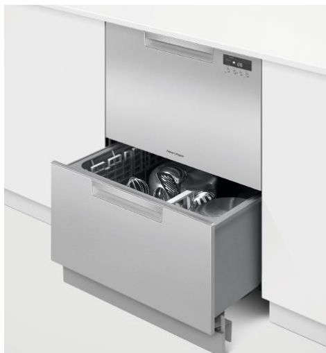
DishDrawer® DOUBLE Classic logé dans un emplacement lave-vaisselle standard

Les plus grandes familles préféreront deux tiroirs. En fonction de l'espace disponible dans la cuisine, il est possible d'opter pour un seul DishDrawer® à double tiroir monobloc (voir photo de gauche) ou, pour un confort optimum, deux DishDrawer® simple tiroir dissociés (voir photo de droite).