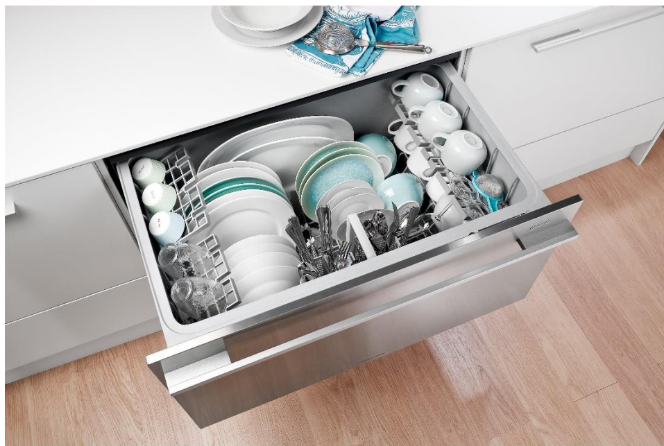
DishDrawer® LARGE Designer – la version XL du modèle simple tiroir

* programmes : rinçage, délicat, rapide, intensif, normal + fonction Eco